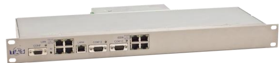
Abb.: TCS 19" 1HE